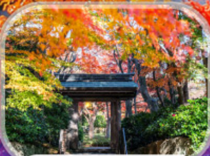
พิพิธภัณฑ์ศิลปะโมเอ