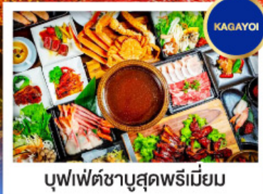
บุฟเฟ่ต์ซาบุดะพรีเมียม