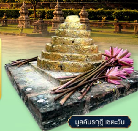
มุลคันรฤฎี เขตตะวัน