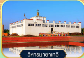
วิหารมายาเทวี