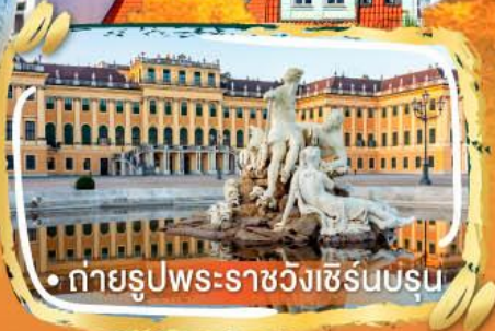
• ถ่ายรูปพระราชวังเซิร์นบรุน