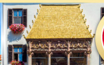
หลังคาทองคำอินน์สบูร์ค