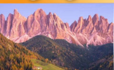
อุทยานแห่งชาติโดโลไมท์