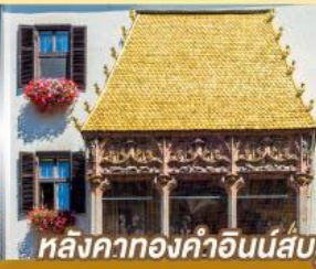
หลังคาทองคำอินน์ส์บรุค