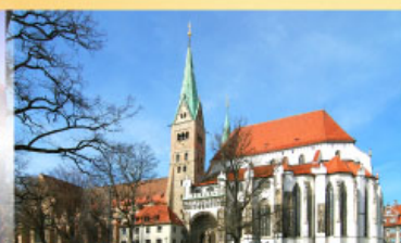
มหาวิหารเอาค์สเวิร์ค