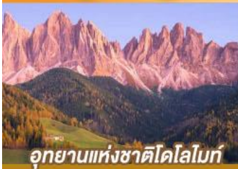
อุทยานแห่งชาติโดโลไมท์

ขึ้นเครื่องบินอัมสเตอร์ดัม กับเส้นทางสายโรแมนติก พร้อมการแสดงพื้นบ้านสไตล์ที่โรเลียนสุดพิเศษ