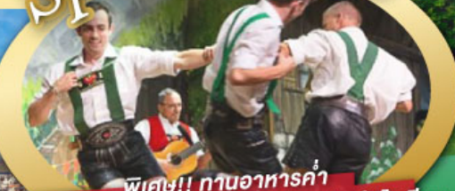
พิเศษ!! ทานอาหารค่ำ พร้อมชมการแสดงดนตรีพื้นเมืองสไตล์โรเลียน และเยือนเมืองอูเทรคต์ สีสันใหม่เนเธอร์แลนด์

ไฮไลท์ในโปรแกรม • เยือนเมืองแห่งแคว้นบาวาเรีย และ ทิโรล • สุกสนานเหมืองเกลือเบิร์ชเทสกาเดิน • เข้าชมปราสาทนอยชวานสไตน์ • เดินเล่นจัตุรัสโรเมอร์ ซอปปิง Zeil Street • ถ่ายรูปมุมสวยของหมู่บ้านอัลสติก • ซิลลา ไปในเมืองซาลสบูร์ก บ้านเกิดโมสาร์ท • ล่องเรือหมู่บ้านทีธูร์น และ ล่องเรือชมนครอัมสเตอร์ดัม • ซอปปิงจุใจย่านดิมสแควร์และเดินเล่นย่านโคมแดง 25 ก.ย. - 04 ต.ค. 69 09-18, 16-25 ต.ค. 69 22-31 ต.ค. 69 / 06-15 พ.ย. 69 29 ธ.ค. 69 - 07 ม.ค. 70 * ปีใหม่ *