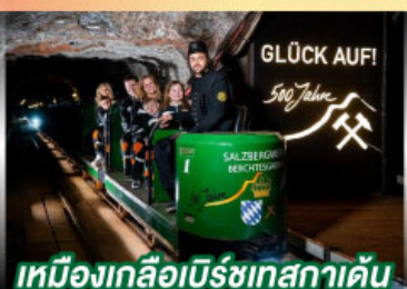
เหมืองเกลือเบิร์ชเทสกาเดิน