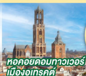
หอคอยคอกทาวเวอร์ เมืองอูเทรคต์