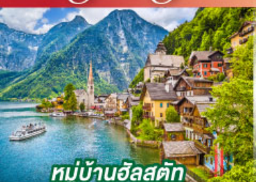
หมู่บ้านอัลสติก