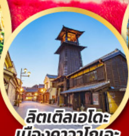
ลิตเติลเอโดะ เมืองคาวาโกเอะ