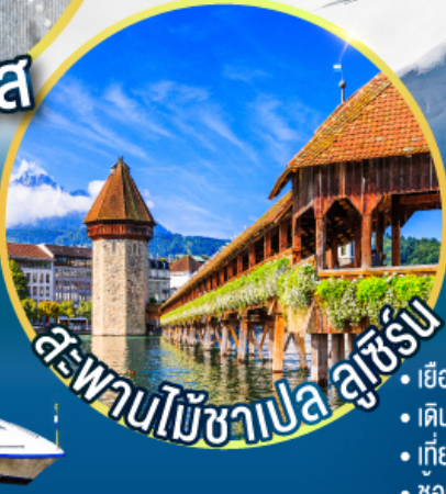
สะพานไม้ชาเปลลูเซิร์น