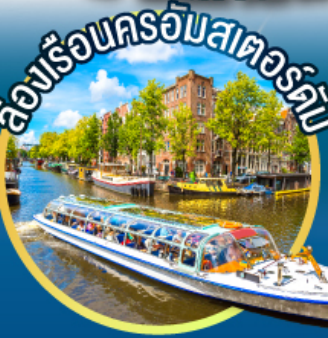
ล่องเรือนครอัมสเตอร์ดัม