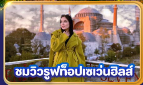
ชมวิวยูพีทือปเซเวนฮิลส์