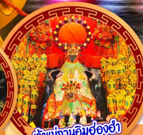
เจ้าแม่กวนอิมฮ่องฮ่า

นมัสการเจ้าแม่กวนอิมฮ่องฮ่า หมุนกังหันรับโชคลากเงินทองที่วัดแชงหมิว ขอพรความรักกับผู้เต่าจันตรา วัดหวังต้าเซียน