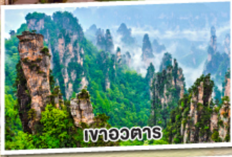
เหวอหวตาร