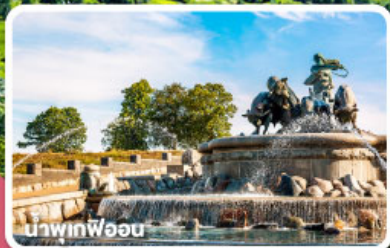
น้ำพุเฟอออน