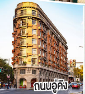
ถนนอู่คิง

เที่ยวมหานครเซี่ยงไฮ้.. ตามรอยซีรีส์จีนที่ Hengdian World Studios