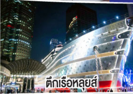
ตึกเรือหลุยส์