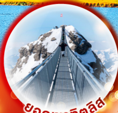
ยอดเขาทิตลิส