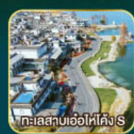
ทะเลสาบเอ๋อไห่คัง S