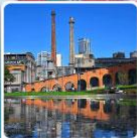
Eastern Suburb Memory Chengdu