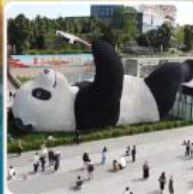
รูปปั้นแพนด้าเซลฟ์