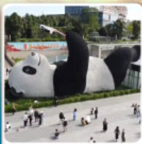
รูปปั้นแพนด้าเซลฟี