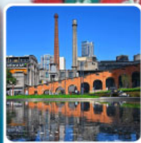
Eastern Suburb Memory Chengdu