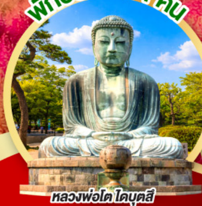
หลวงพ่อดโต โดบุตสึ