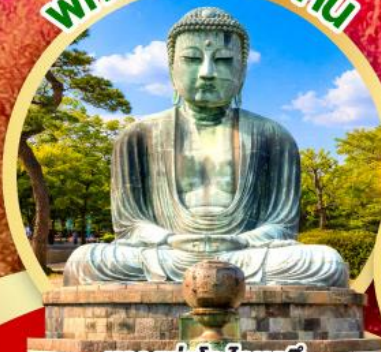
หลวงพ่อดโต โดบุตสึ