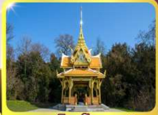
ศาลาไทยไชยาน์

11-18 มิ.ย. 69 / 25 มิ.ย. - 02 ก.ค.69 02 - 09, 16-23 ก.ย.69 / 07 -14, 22-29 ต.ค.69 เดินทาง : 04 - 11, 11-18 พ.ย.69 25 พ.ย. - 02 ธ.ค.69 03 - 10, 23-30 ธ.ค.69 / 23 - 30 ธ.ค. 69 29 ธ.ค.69 - 05 ม.ค.70