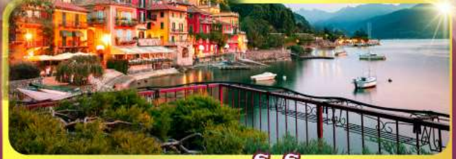
ทะเลสาบโลโบ

11-18 มิ.ย. 69 / 25 มิ.ย. - 02 ก.ค.69 02 - 09, 16-23 ก.ย.69 / 07 -14, 22-29 ต.ค.69 เดินทาง : 04 - 11, 11-18 พ.ย.69 25 พ.ย. - 02 ธ.ค.69 03 - 10, 23-30 ธ.ค.69 / 23 - 30 ธ.ค. 69 29 ธ.ค.69 - 05 ม.ค.70