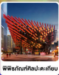
พิพิธภัณฑ์ศิลปะตะเกียบ