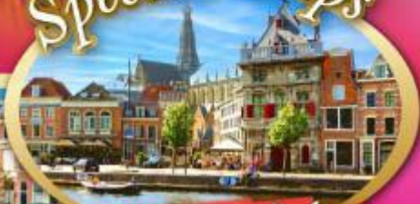
เก็บครบเบเนลักซ์ แะที่ฮาร์เล็ม