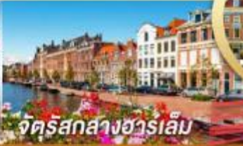
จัตุรัสกลางฮาร์เล็ม