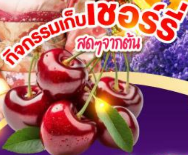
ทุ่งดอกลาเวนเดอร์ ไทมิตะฟาร์ม