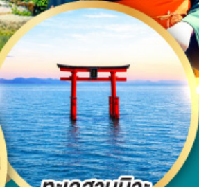
ทะเลสาบบิวะ เสาโทริอิ

เส้นทางสายอัลไพน์ทากายามา กำแพงหิมะ เพื่อนคู่โรเบะ