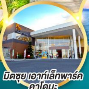
มิตซึยะ เอาท์เล็ตพาร์ค คาโตะมะ