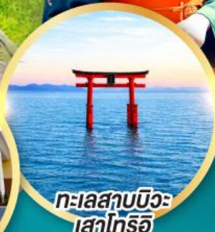
ทะเลสาบบิวะ เสาโทริอิ

เส้นทางสายอัลไพน์ทาเคยาม่า กำแพงหิมะ เขื่อนคุโรเบะ