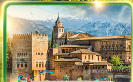
พระราชวังอาลัมบรา