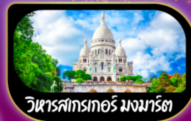
วิหารสกรเกอร์ มงมาร์ต