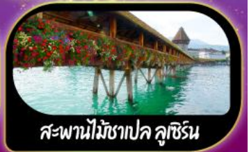
สะพานไม้ชาเปล คูชีริน