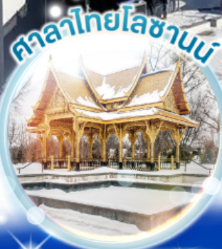
ศาลาไทยโลซานน์