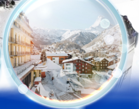
เซอร์แมก