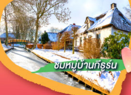
ชมหมู่บ้านกิธูร์น