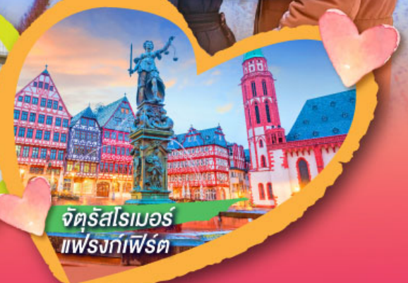
จัตุรัสโรเมอร์ แฟรงก์เฟิร์ต