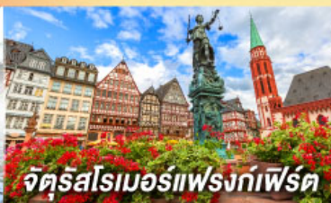
จัตุรัสโรเมอร์เฟรงก์เฟิร์ต