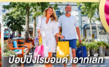
ป๊อปบิงโรมอนด์ ไอท์เล็ก