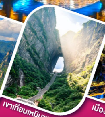
เจาเทียนเหมินทันฟ้าใส