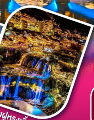
เมืองฝูหรงเจิน