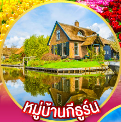
หมู่บ้านที่รูรัม