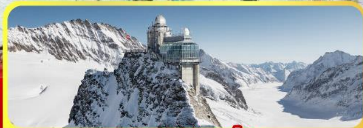
ยอดเขาลุงเฟรา