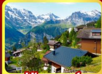
หมู่บ้านเมอร์เซ