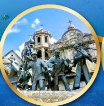
อนุสาวรีย์มรดกแห่งเซบู