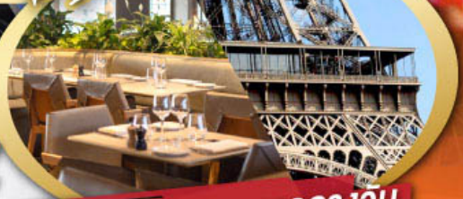
รับประทานอาหารกลางวัน บนหอคอยเฟลา

ไฮไลท์ในโปรแกรม • ถ่ายรูปหอคอยเฟลาและพีพีร์กันท์ลูฟท์ • สะพานไม้ชาเปล ลูเซิร์น • ขึ้นกระเช้าสู่ยอดเขาจุงเฟรา • เมืองมรดกโลก กรุงเบิร์น • ถ่ายรูปปราสาทซิลยงที่ม็องเทรอซ์ • ศาลาไทย เมืองโลซานน์ • เดินเพลินๆ ณ เมืองเวเวย์