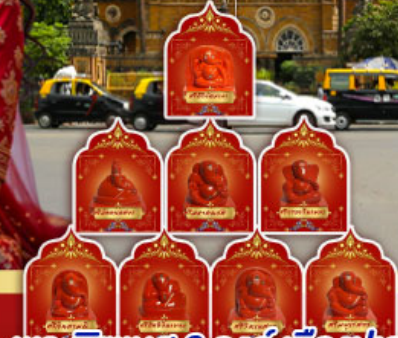
พระพิฆเนศ 8 องค์ เมืองปูณ

" อินเดียครั้งนี้ ไม่ใช่แคกริป แต่คือการเปลี่ยนแปลง ปลุกพลังในตัวคุณ... ด้วยพิธีกรรมศักดิ์สิทธิ์ ณ สถานที่จริง ของพระพิฆเนศ ดินแดนแห่งปญญาและพรสูงสุด"