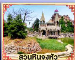
สวนหินจงหัว