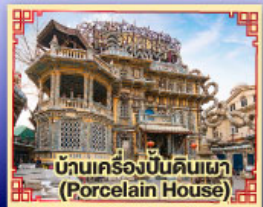
บ้านเครื่องปั้นดินเผา (Porcelain House)

มือพิเศษ.. เปิดปักกิ่ง, ปังย่างเกาหลี, สุกี้ Haidilao