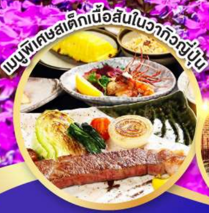
แบบพิเศษเด็กเนื้อสันในวากิวญี่ปุ่น

พัทช์ชิโร 2 คืน ระดับ 4 ดาว ไกลน่องช้อปปิ้ง