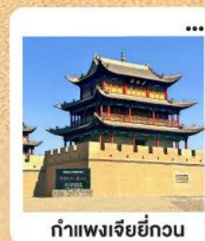
กำแพงเจียยี่กวน