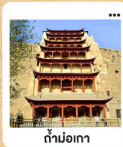
ถ้ำม่อเกา