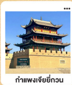
ถ้ำเพงเจียถู่กวน