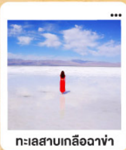
ทะเลสาบเกลือฉางซ่า