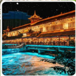
Blue Tears สะพานหนานเฉียว