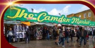
ตลาดแคมเดน