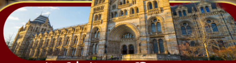
พิพิธภัณฑ์ประวัติศาสตร์โลกทางธรรมชาติ