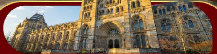
พิพิธภัณฑ์ประวัติศาสตร์โลกทางธรรมชาติ