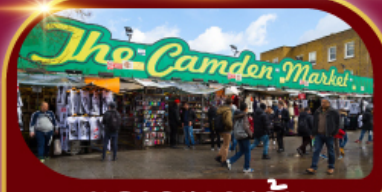
ตลาดแคมเดน