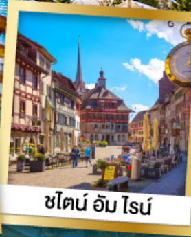
ชไตน์ อัม โรส