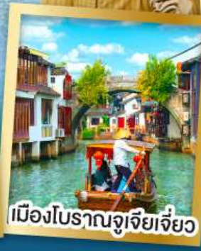
เมืองโบราณจูเจียเจี้ยว