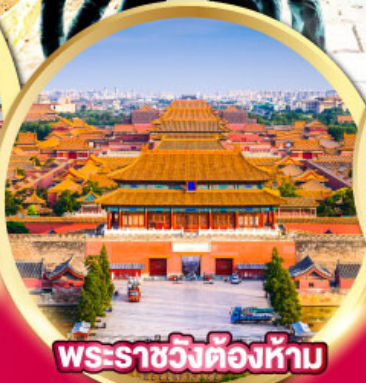
พระราชวังต้องห้าม