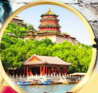
พระราชวังฤดูร้อน