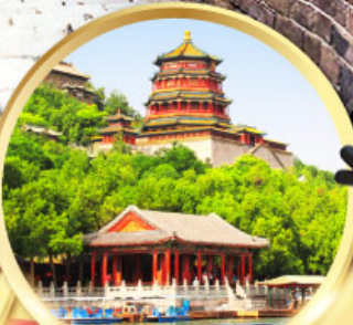
พระราชวังฤดูร้อน