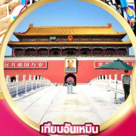
เทียนอันเหมิน