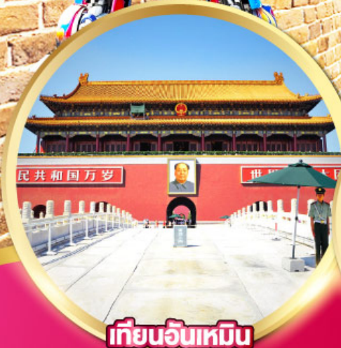
เทียนอันเหมิน