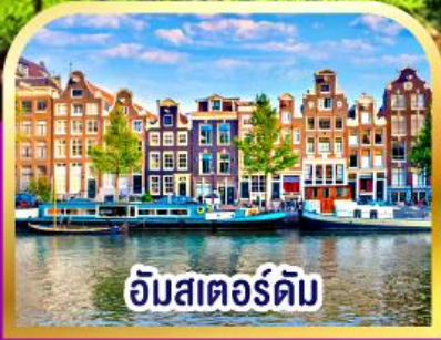
อัมสเตอร์ดัม