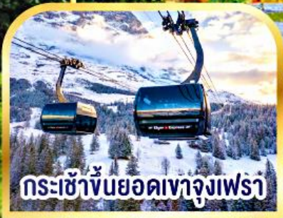
กระเช้าขึ้นยอดเขาจุงเฟรา