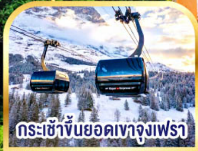
กระเช้าขึ้นยอดเขาจุงเฟรา