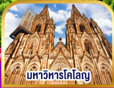
มหาวิหารโคโลญ

✓ ล่องเรือที่หมู่บ้านที่กรุง เวนิสแห่งเนเธอร์แลนด์