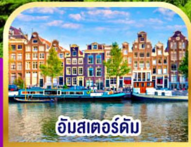
อัมสเตอร์ดัม