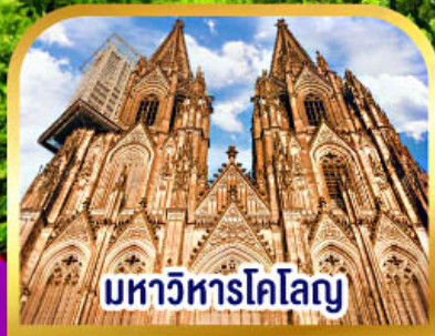
มหาวิหารโคโลญ

✓ ล่องเรือที่หมู่บ้านที่รูน เวนิสแห่งเนเธอร์แลนด์