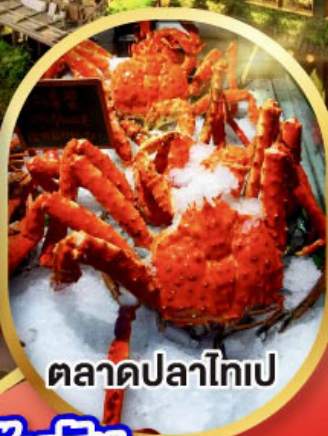
ตลาดปลาไทเป