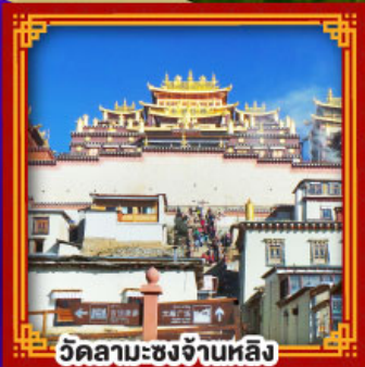
วัดลามะชงจ้านหลิ่ง