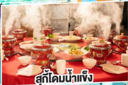
สุกี้ไคมน้ำแข็ง