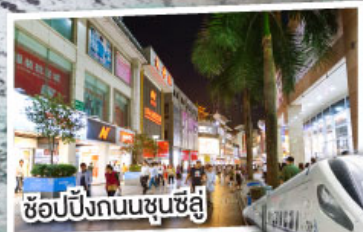
ช้อปปิ้งถนนชุนชี่