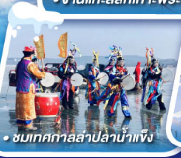
• ชมเทศกาลล่าปลาน้ำแข็ง