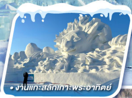
• งานแกะสลักเทวพระอาทิตย์

งานเทศกาลแกะสลักหิมะที่ใหญ่ที่สุดในโลก HARBIN ICE & SNOW FESTIVAL 2025 เที่ยวหมู่บ้านหิมะ ดินแดนหิมะอันสุดประทับใจ