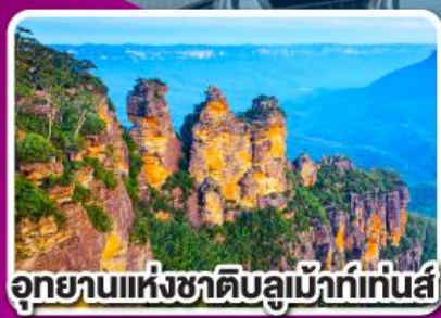
อุทยานแห่งชาติบลูเมาท์เทนส์

พิเศษ เมนูภัตตาคาร 1 ตัว พร้อมไวน์ชั้นเยี่ยม