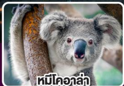
หมีโคอาล่า