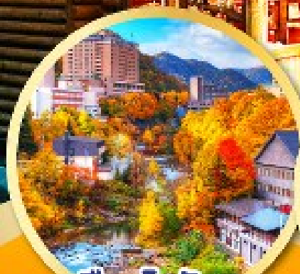
เมืองโจเซ็งเค