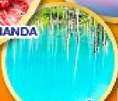
บรูพอนต์ (บ่อน้ำสีฟ้า)