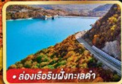
• ล่องเรือริมฝั่งทะเลดำ